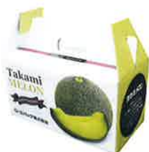
T-2 タカミメロン 2玉入り