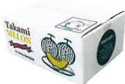
T-1 タカミメロン 5kg 詰め T-3 優品タカミメロン 5kg 詰め